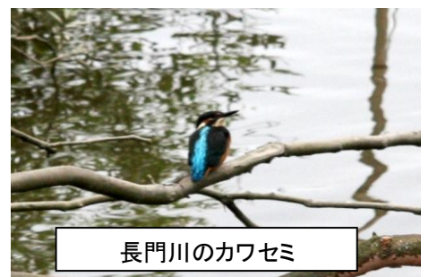
長門川のカワセミ