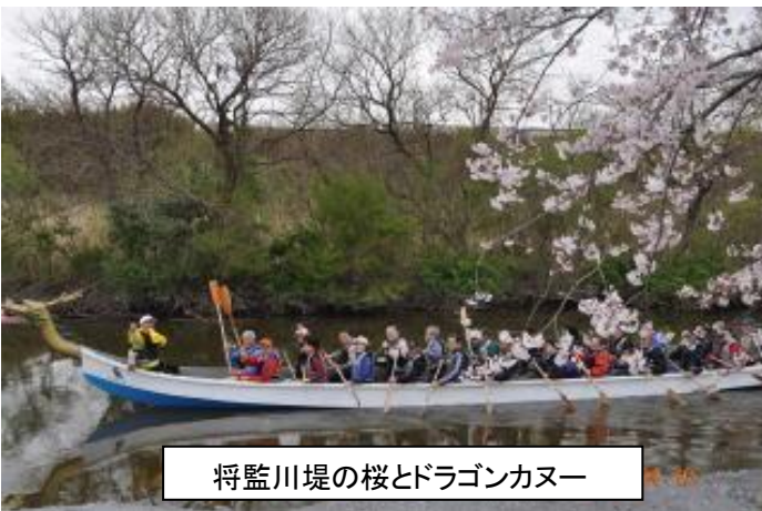
将監川堤の桜とドラゴンカヌー