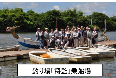
釣り場「将監」乗船場

ドラゴンカヌーカワセミ1号 は平成22年4月より利根川水系の将監川・長門川・利根川を、安全マップに則り一周1時間半から2時間の運航を開始しました。 川面から眺める季節毎の景色はまた格別。4月の満開の桜、新緑の柳の葉、ボラのジャンプ、群生する椿、水辺の宝石カワセミ、野鳥が間近に飛翔する姿等を観察できます。近隣には「房総のむら」『風土記の丘』『龍角寺』『桜の小林牧場』といった、見どころいっぱいの栄町です。近隣の名所観光と合わせて、脱日常体験を十二分に楽しめます。今まで乗船された方全員から「あー楽しかった！」という感想をいただいております。皆さまの乗船体験参加、お待ちしております。