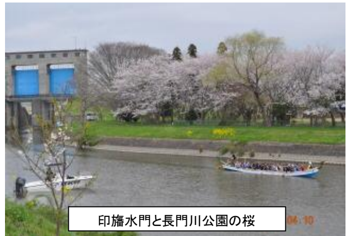
印旛水門と長門川公園の桜

ドラゴンカヌーカワセミ1号 は平成22年4月より利根川水系の将監川・長門川・利根川を、安全マップに則り一周1時間半から2時間の運航を開始しました。 川面から眺める季節毎の景色はまた格別。4月の満開の桜、新緑の柳の葉、ボラのジャンプ、群生する椿、水辺の宝石カワセミ、野鳥が間近に飛翔する姿等を観察できます。近隣には「房総のむら」『風土記の丘』『龍角寺』『桜の小林牧場』といった、見どころいっぱいの栄町です。近隣の名所観光と合わせて、脱日常体験を十二分に楽しめます。今まで乗船された方全員から「あー楽しかった！」という感想をいただいております。皆さまの乗船体験参加、お待ちしております。